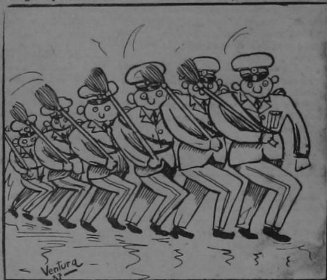
¡Presenten armas! ¡Ar...!

(Los periódicos anuncian que el 15 de setiembre tendremos una gran parada militar en honor del señor Presidente y al efecto van a instruir a 1.000 estudiantes).